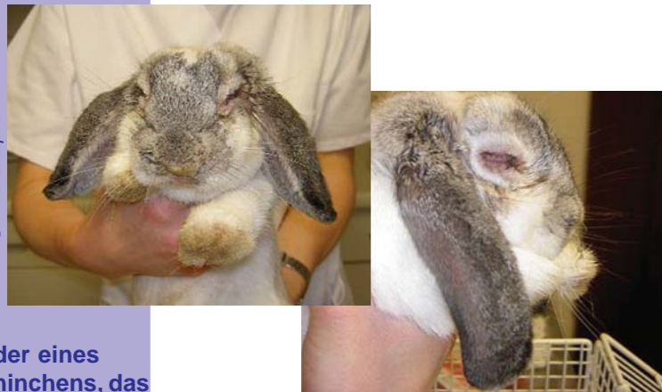
Bilder eines Kaninchens, das an Myxomatose erkrankt ist. Typisches Merkmal: starke Schwellungen der Augen.

Ansteckungsgefahr auch für Wohnungskaninchen