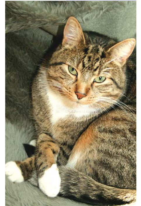
Kater Elvis: eine Woche im Ausnahmezustand

Eine heftige Woche liegt hinter mir. Mein Herrchen war geschäftlich unterwegs und ich war plötzlich der einzige Mann im Haus! Unordnung ade: Keine Decke blieb auf der Couch liegen, kein Kühlschrank stand offen, kein Stück Käse blieb auf dem Esstisch liegen. Niemand vergaß den frischen italienischen Schinken auf dem Tisch! Alles super ordentlich. Ein Graus!