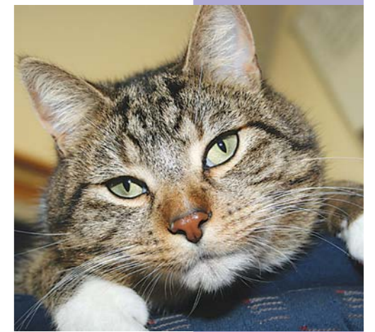
Kater Elvis entpuppt sich als Gentleman.