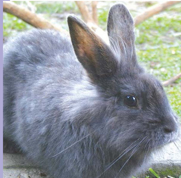
So fühlen sich Kaninchen auch im Winter draußen wohl: mit einer Schutzhütte und einem großen Auslauf.

Gesunde Kaninchen können das ganze Jahr über – also auch im Winter – in einem Außengehege leben. Voraussetzung ist, dass die Tiere bereits seit März, spätestens seit September, draußen gehalten werden. So gewöhnen sie sich langsam an Außentemperaturen und entwickeln später ihr Winterfell. Da Bewegung die Tiere warm hält, ist ein Auslauf dringend erforderlich. Das Gehege kann nicht groß genug sein. Als Mindestmaße empfehlen Experten zwei Quadratmeter Auslauf pro Kaninchen.