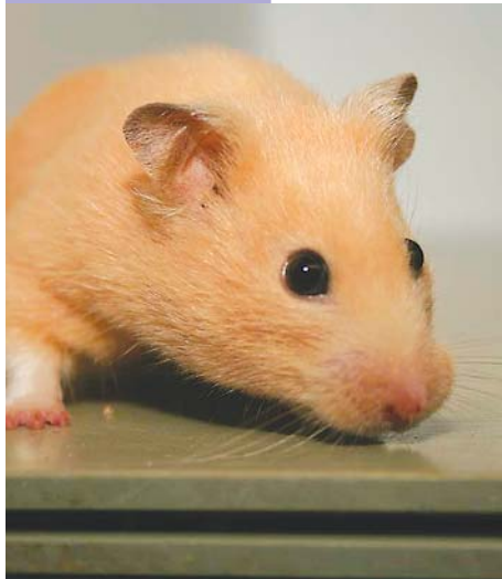
Mit ein bisschen Kühlung fühlen sich Hamster auch im Sommer wohl.

Bei großer Hitze sind Hamster träge und bewegen sich kaum. Hier sollten Sie die Fütterung ein wenig anpassen, d.h. mehr fettarme Getreidesorten, weniger Nüsse oder Kerne. Prima Durstlöscher sind Gurkenstücke und Salate. Kontrollieren Sie regelmäßig die Futtermittel Ihres Hamsters. Gerade im Sommer bilden sich bei hoher Luftfeuchtigkeit schnell Schimmel und Würmer.