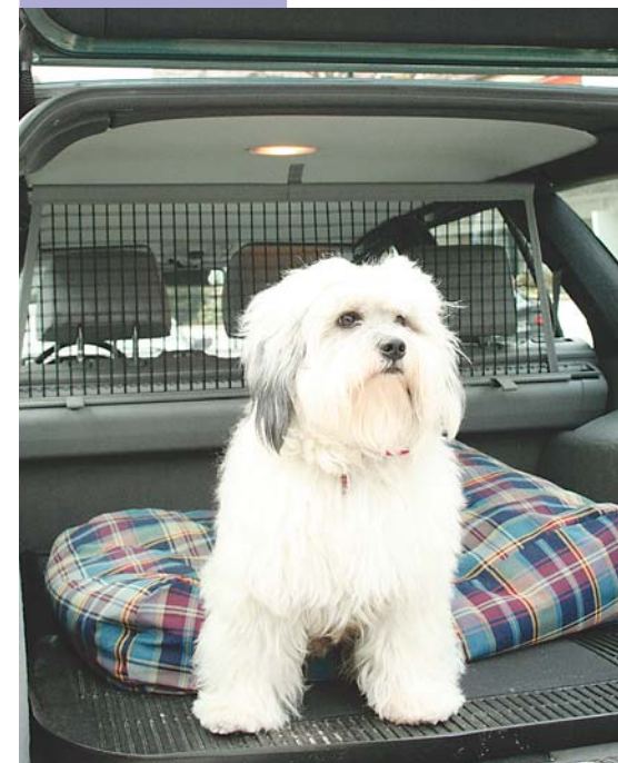
Tibeterrier Newton auf großer Fahrt. Die größte Sicherheit sollen Transportboxen bieten.